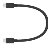
USB-C 轉USB-C 傳輸線