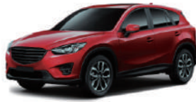
Uplus 汽車隔熱紙 全車貼膜 C2 小休旅車