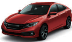
Uplus 汽車隔熱紙 全車貼膜 C1 小型車