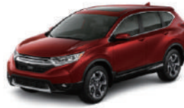
Uplus 汽車隔熱紙 全車貼膜 C3 中型車